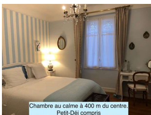
Chambre au calme à 400 m du centre. Petit-Déj compris

Contact : +33 6 89 07 20 09 daxlacroixblanche@gmail.com www.daxlacroixblanche.fr